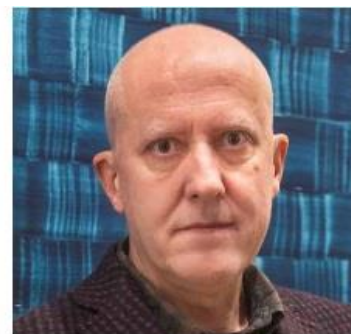
Juan Usle.

Le déroulement du vote à distance est aussi un modèle d'adaptation pour les prix artistiques dans un contexte difficile. « Nous ne pouvions pas