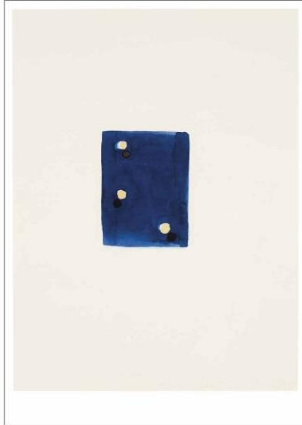
Juan Uslé, Lunada , 1995, aquarelle sur papier, 30,5 x 22,9 cm.